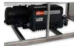
Équipé avec une pompe Busch de 40 m 3 /h 230-575, 3 phases, 60 Hz, 2 HP

Le processus d'auto-nettoyage vous aide de préserver votre appareil et la pompe à leur performance optimale et aussi de rallonger leur durée de vie..